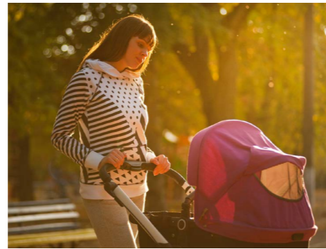
Nu kan du ta med barnvagn och även cykel på regionbussarna.